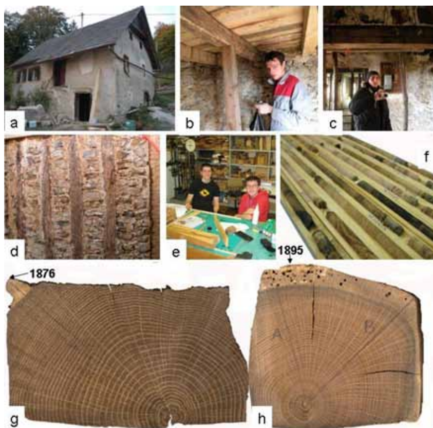
Slika 1. Matičkova domačija: (a) hiša pred prenovo, (b,c) lesene konstrukcije, (d) predelna stena, (e) študenta pri pripravi vzorcev za analize, (f) nalepljeni izvrtki pred brušenjem, (g) obdelana odrezka hrasta z jedrovino in beljavo in datumom nastanka zadnje branike.

V laboratoriju smo izvrtke nalepili na letvice z utori (slika 1f). Nalepljene izvrtke in odrezke smo nato pobrusili v mizarski delavnici s tračnim brusilnim strojem z brusnim papirjem, od bolj grobe do fine granulacije št. 80, 120, 180, 240, 280, 320 in končno 400.