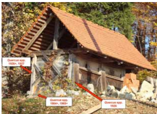
Slika 3. Svinjak z oznakami mest odvzemov vzorcev, lesno vrsto ( Quercus - hrast) in datumi zadnjih branik. (+) pomeni, da nekaj branik manjka in da je bil les posekan in vgrajen po navedenem letu.

brez beljave) pa sta bila očitno zamenjana po letu 1969.